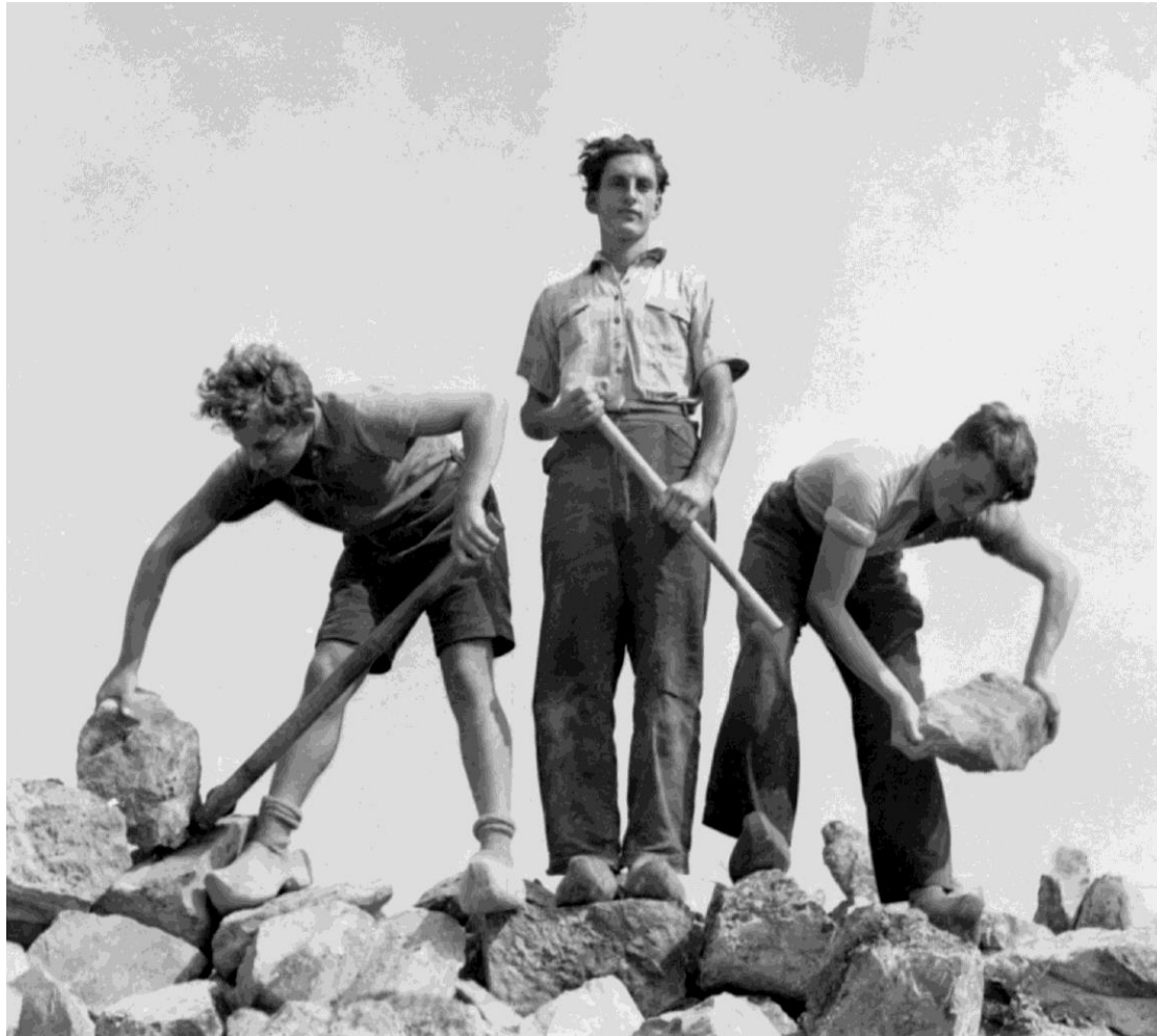
Opleiding jongeren Ned. Zionistenbond, Wieringermeer, foto Roman Vishniac 1939